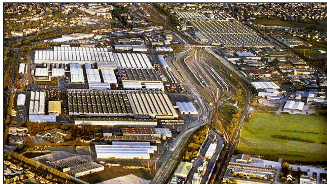
■ Le site de PSA, un atout pour Noidans-lès-Vesoul.

Pourtant, ce territoire où la ville centre (environ 3500 électeurs sur les 13.205 recensés en février 2014) pèse finalement moins que les communes rurales ou périurbaines (comme Noidans-lès-Vesoul, Échenoz-