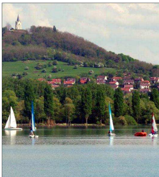
■ Le lac de Vaivre, lieu de détente à succès.

► Les communes du nouveau canton de Vesoul 1 : Andelarrot, Andelarrot, Chariez, Charmoille, Échenoz-la-Méline, Montigny-lès-Vesoul, Mont-le-Vernois, Noidans-lès-Vesoul, Pusey, Pusey-et-Épenoux, Vaivre-et-Montoille et Vesoul Ouest.