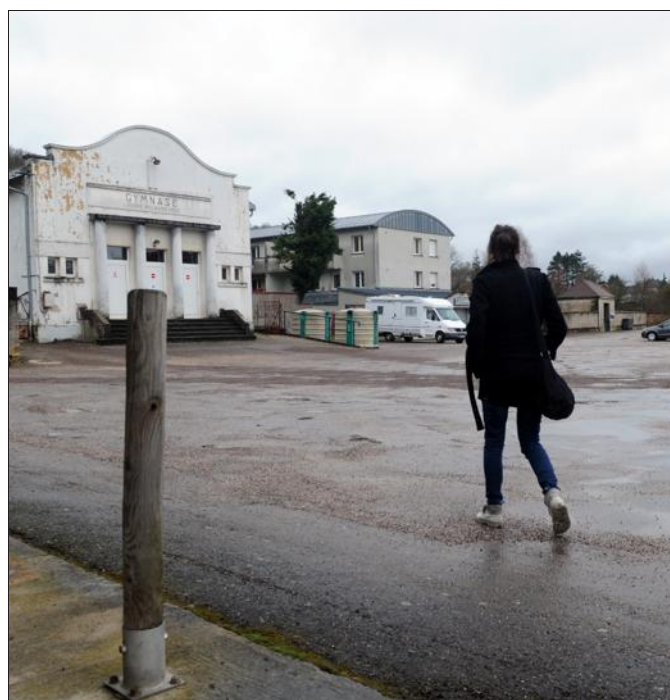
■ A Echenoz, les trois candidats ont leur projet pour l'ancienne place d'Armes.

Les enjeux pour la commune dans le futur selon eux ? « Augmenter encore la population et densifier l'urbanisa-