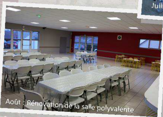
Août : Rénovation de la salle polyvalente