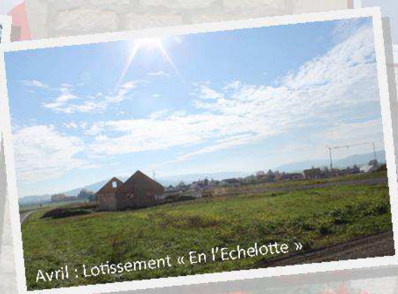
Avril : Lotissement « En l'Echelotte »