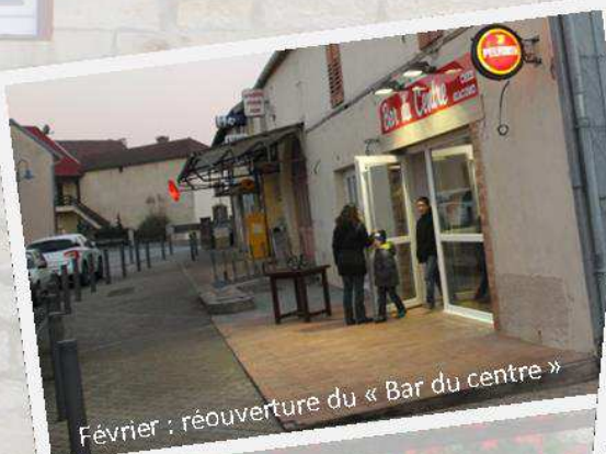
Février : réouverture du « Bar du centre »