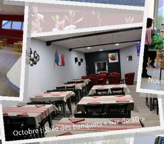
Octobre : Salle des banquets « Bar de 3D »