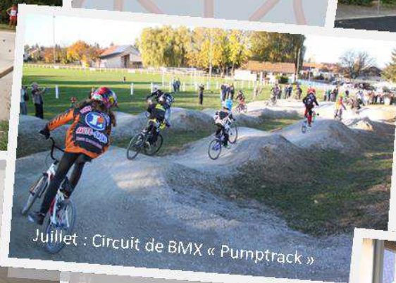
Juillet : Circuit de BMX « Pumptrack »