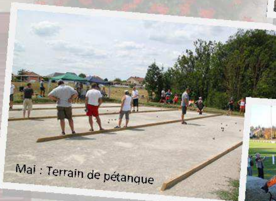
Mai : Terrain de pétanque