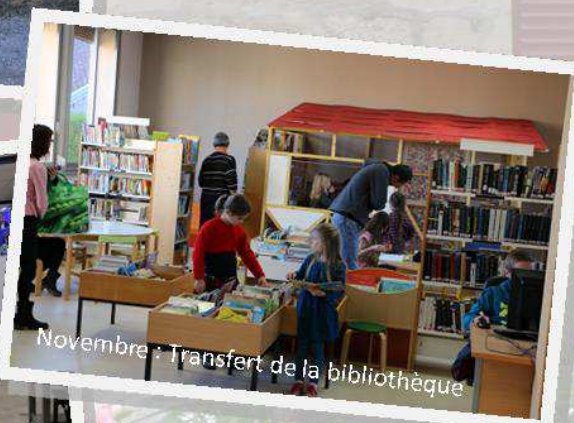
Novembre : Transfert de la bibliothèque