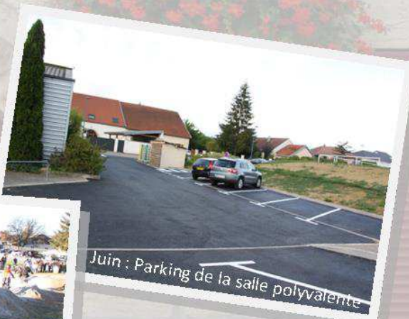
Juin : Parking de la salle polyvalente