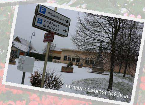
Janvier : Cabinet Médical