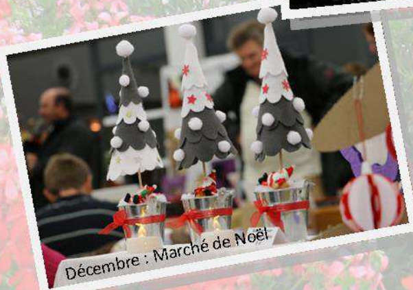
Décembre : Marché de Noël